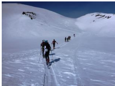
Gipfelsieg am Hochstaff